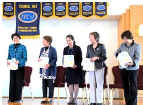
第38期役員ご苦労様でした。