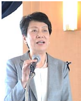
インストラリングオフィサー