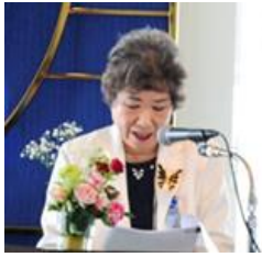
プログラムリーダー